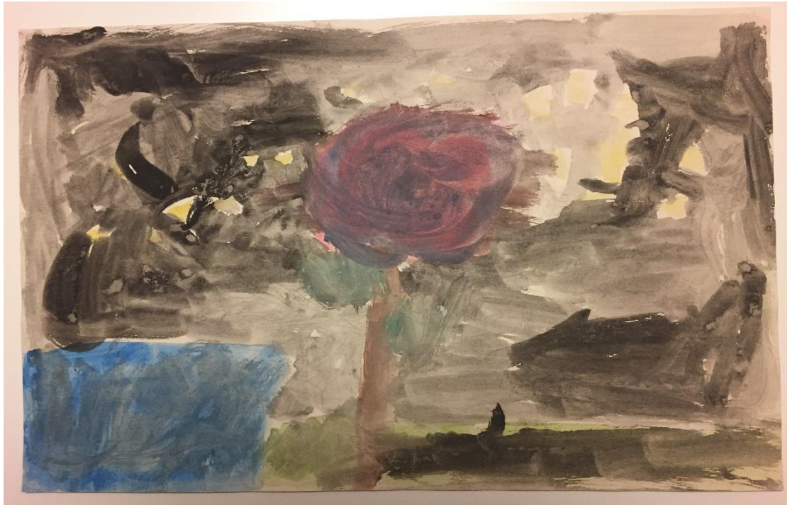
תמונה 2 : החשכה כסמל הטראומה

אפשר לראות בעבודה ראשונה זו שני שלבים בהתפתחות הנפש: השלב הטרום-טראומטי, שקלשד (Kalsched, 2013) מכנה "הגרעין הפנימי הבלתי ניתן להכחדה", הגרעין הפנימי של העצמי, גרעין ארכיטיפי שנשמר כל עוד יש חיים. קלשד מתאר כיצד ברמה הפנימית הנפש מתחילה לצייר (חלומות, ציורים, תוצרי נפש) ומספרת על משהו נורא שאירע לתמימותה. הדברים מתחילים לשפוך אור על הנפש הטרום-טראומטית, המיוצגת על ידי הפרח עם ההילה הוורדרדה, ועל חוויית הטראומה עצמה, המיוצגת בהתהוות הכיסוי החשוך. מושג התמימות מבטא את ליבת החיות הטהורה, שלא זוהמה, והיא מסומלת על ידי דימוי ילד שחווים אותו בילדות המוקדמת אגב יצירה וגילוי. התמימות המתפתחת במצב נורמלי קרובה לעצמי הספונטני הנצחי, תוצאה של הצטברות של טיפול אימהי מספיק טוב, שמוביל להשתכנות הנפש. המצב הטראומטי, שהוא השלב השני, הוא הכאב הבלתי נסבל והתפתחות הדיסוציאציה שמפרידה בין שני העולמות שאמורים לייצג את ההתנסות בשלמותה. הציור המכוסה בחשכה מייצג את המצב הדואלי של הנפש: מצד אחד הכוכבים מייצגים את האור, את התקווה ואת הכמיהה לתנועה ושינוי, ומן הצד האחר המים ההופכים עכורים מספרים על התקיעות ועל הקיפאון שהנפש נתונה בהם בעקבות הטראומה.