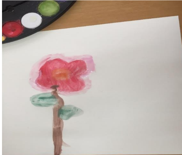
תמונה 1: הפרח לפני החושך

בפעם הראשונה שבה עמית הסכים ליצור הוא בחר לצייר בצבעי מים. בשלב הראשון החל בציור פרח פורח והקיף אותו במעין הילה ורדרדה (תמונה 1).