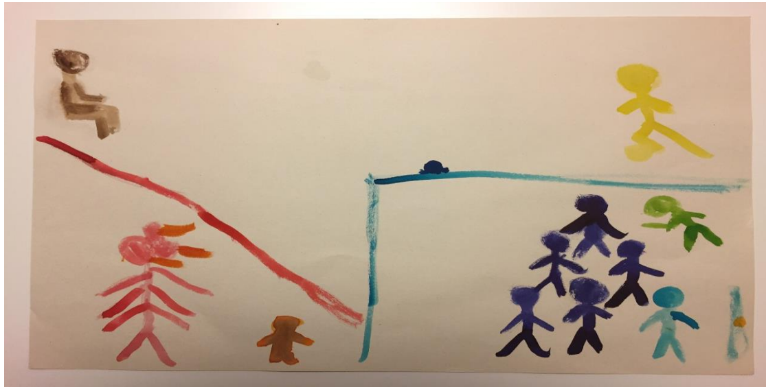
תמונה 3 : אזור האלימות ואזור ההגנה

תצורה נוספת של מיפוי מפת הנפש הדיסוציאטיבית מוצגת בתמונה 3.